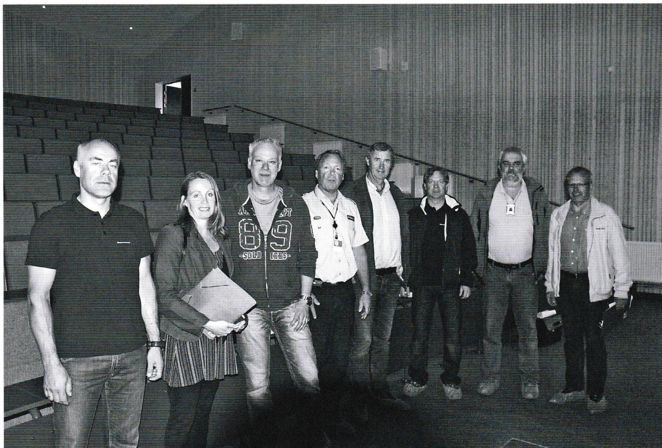
Nøkkelpersoner ved etableringen av nytt auditorium.

Så gjenstår det bare for oss i Fredriksvern verfts venner å ønske Forsvarsbygg og PHS tillykke med nybygget, og håpe på at dette er et viktig skritt i retning av at PHS blir enda tryggere etablert inne på Verftets område.