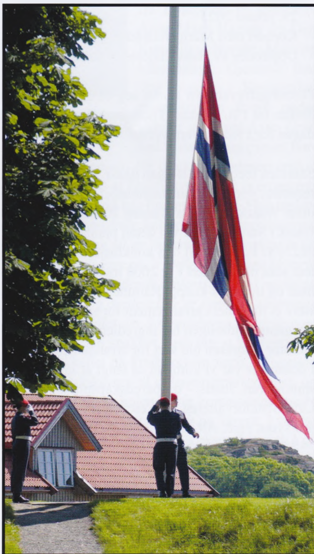
Orlogsflagget fires 21. juni 2002 etter 252 år med militær tilstedeværelse ved verftet