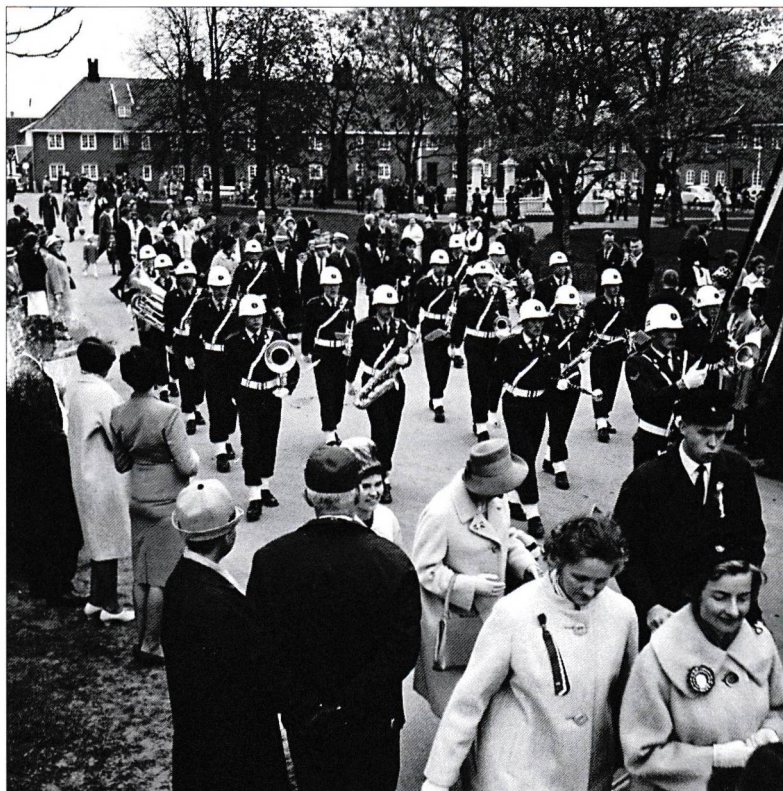
17. mai 1964.