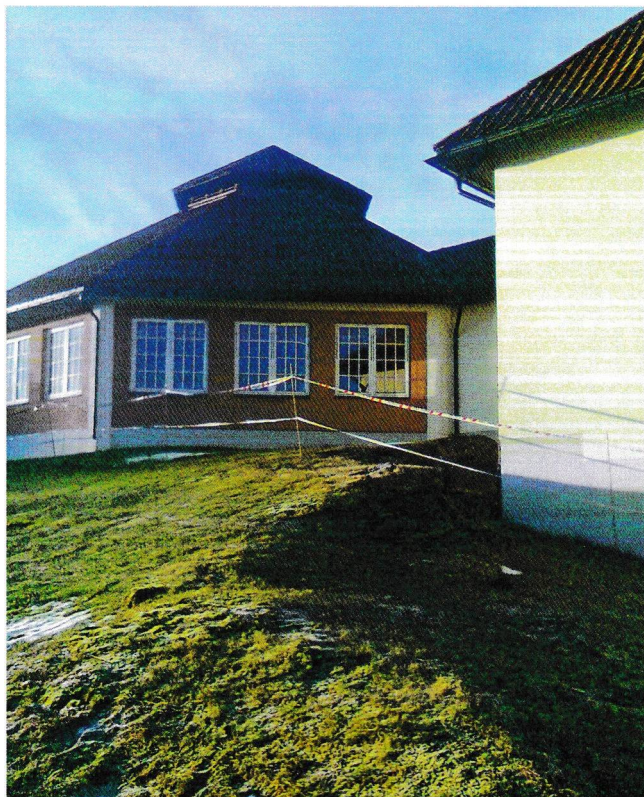
Hele mannskapsmessa er sperret av med merkeband fra Politiet.

Men nå er det altså slutt på alt som har med mat å gjøre i denne fasiliteten. Skadene etter lynnedslaget er svært omfattende. Mellombygget, som er bygget mellom selve spisesalen og kjøkkenet og hvor selve nedslaget var, er forkullet. Hovedloftet over kjøkkenet er røykskadet i en slik grad at det ser ut som det er tjære som ligger på stukkene og lukten er tilsvarende kraftig. Mye av det tekniske anlegget er berørt og antas å ha store skader. I tillegg så førte lynnedslaget til at elektriske spenninger kom «feil»