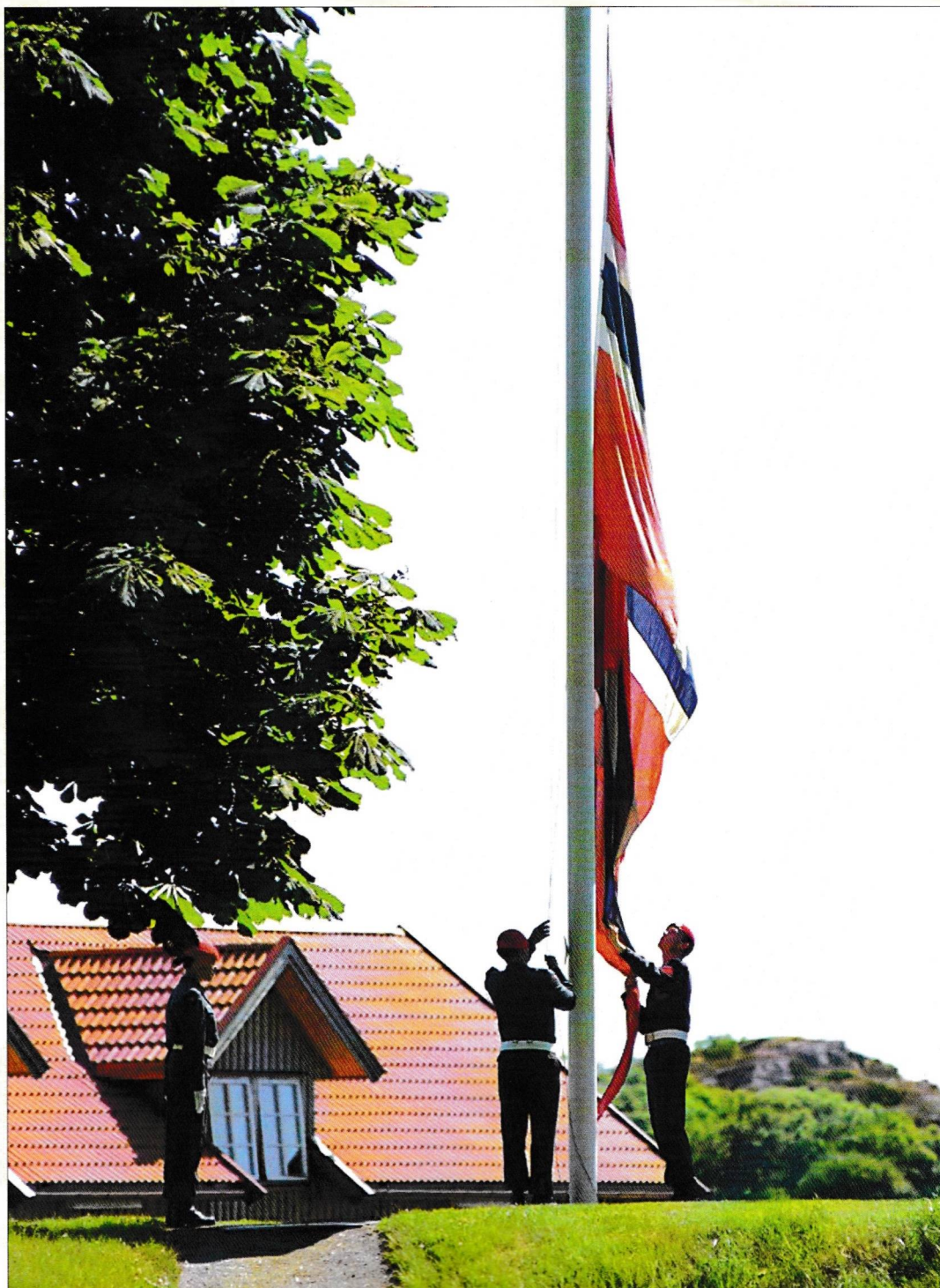
Så var det slutt - siste gang firer Luftforsvarets soldater orlogsflagget ved Fredriksvern Verft 21. juni 2002.

Det var nok bra at ordren om å fjerne flaggstanga ikke ble utført.