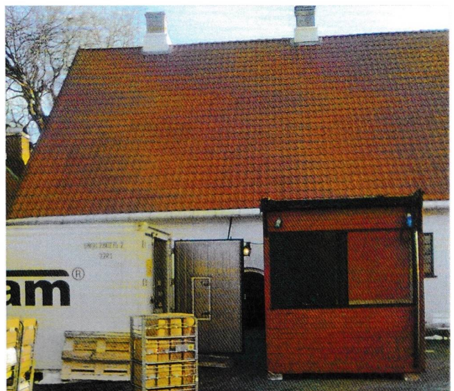
Kontainerbaserte løsninger er nå et «must» for matlagingen ved Verftet.

Men selv om det er mørkt i «Mannskapsmessa» for øyeblikket, så er ikke alt helsvart hva angår gjenombyggingen av denne. Forsvarsbygg Nasjonale festningsverk har gjenoppbygging av kjøkkenet på Fredriksvern som sin topp-prioritet og da er dette nokså sikkert støttet av den øverste ledelsen i Forsvarsbygg. FD er i slutfasen med sitt arbeide med denne saken og da krysser vi fingrene for at det kommer et positivt svar i løpet av et par måneders tid slik at vi i neste nummer av Værfts-Magazinet kan bringe våre lesere en oppdatert status på når vi kan forvente å nok en gang kunne innta et kulinarisk velsmakende måltid i «Mannskapsmessa».