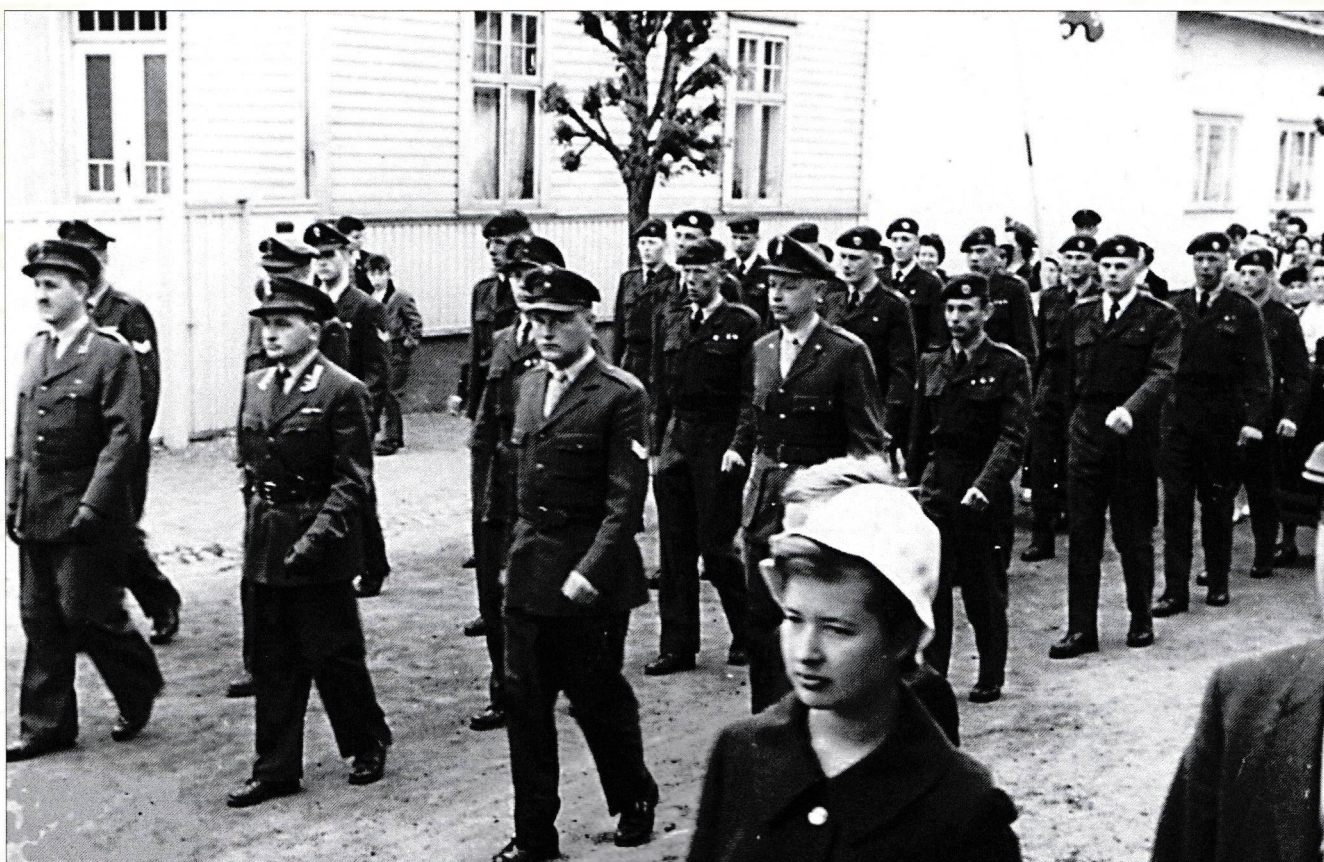
Hatledal leder an i 17. mai toget – rundt 1960