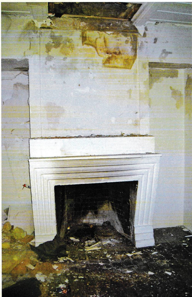
Peis til forfall.