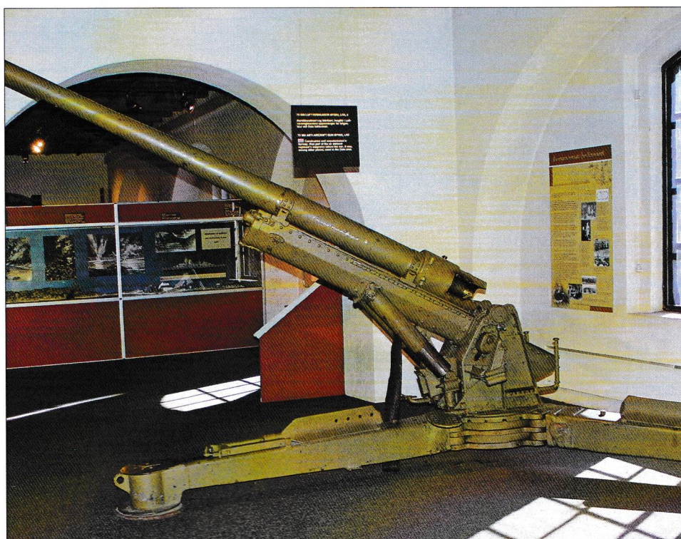
En-skudds luftvernkanon av typen Kongsberg M32 var hovedvåpnet til Luftvernregimentet under kampene om Fornebu 9. april 1940

(Det vises for øvrig til flere detaljer i brigader Øivind Asbjørnsens bok DET NORSKE LUFTVERNARTILLERIS HISTORIE ).