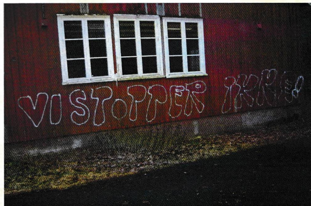
Soldathjemmet er preget av forfall og har vært utsatt for tagging.