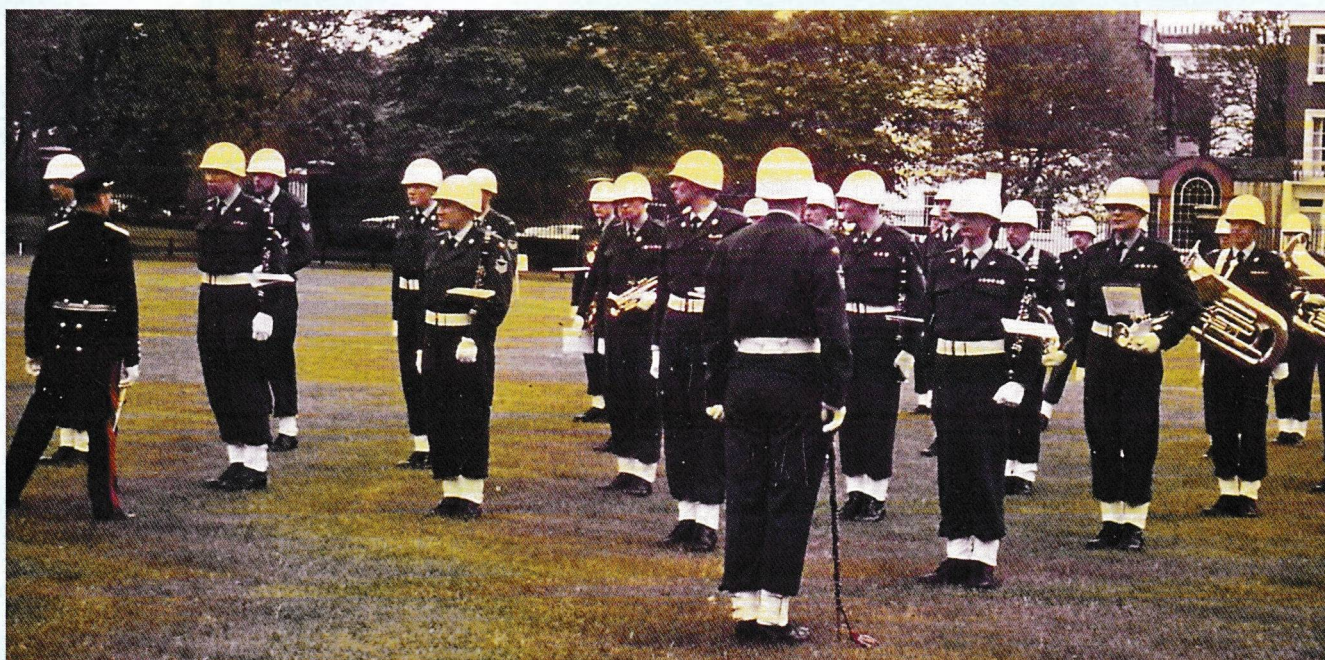
Duke of Yorks Headquarters - 17. mai 1967 – The Royal Norwegian Air Force Band stiller opp før konsert.

Nasjonaldagen opprant med godt sommervær, og i nypressede uniformer med hvitt web, hvit