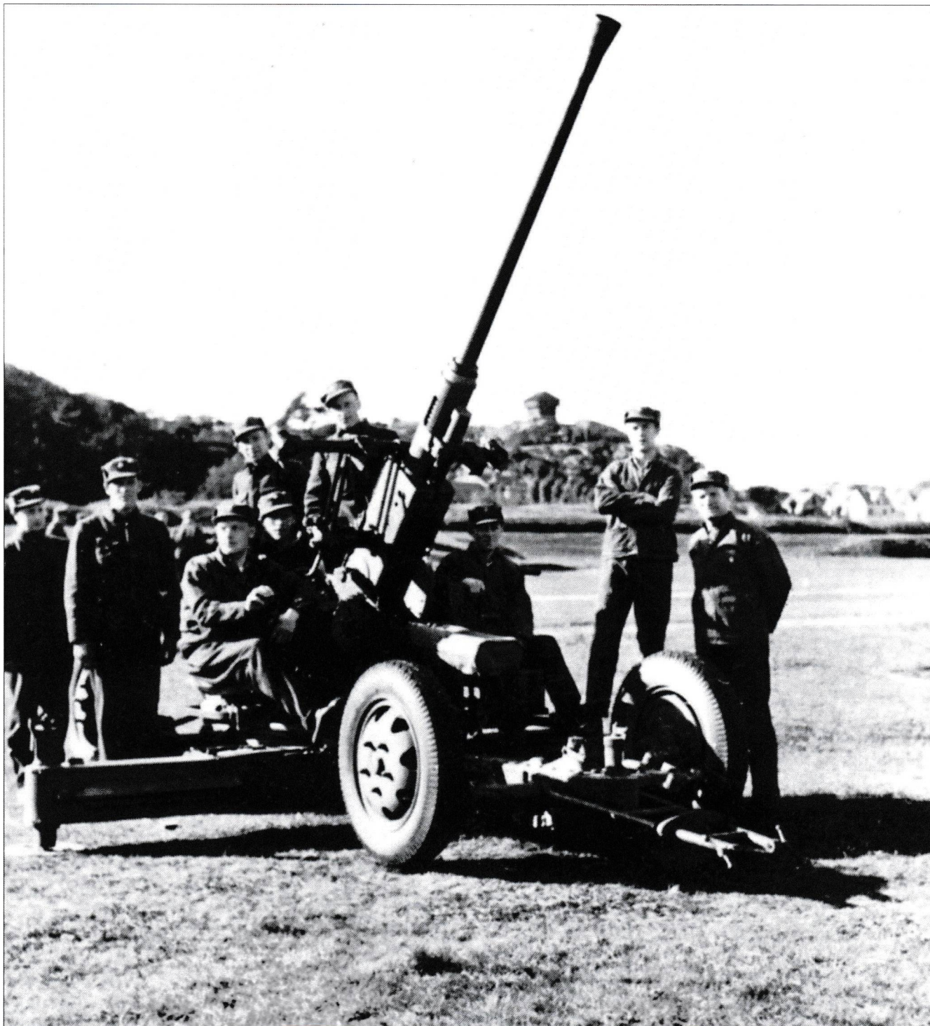
40mm kanon L/60 betjent av Hydro-mannskaper høsten 1939.