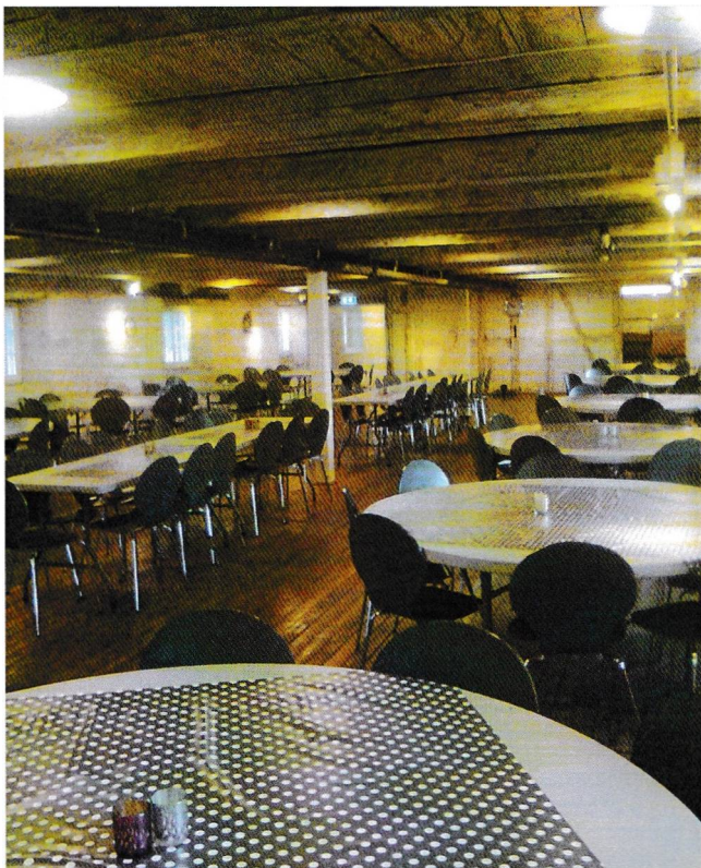
2. etasjen i Steinbrakka er nå blitt spisesal til erstatning for matsalen i mannskapsmessa.

beredskapsdepartementet) som leietaker av bygget, såkalt selvassurandør. Departementene har forståelig nok behov for grundig dokumentasjon for å avsette nødvendige midler til dette prosjektet fremfor andre kritiske behov i egen sektor. Dvs. pengene har de nok, men de ligger ikke inne i noe budsjett eller plan og det må derfor foretas en omprioritering for å kunne skaffe til veie de ca. 50 millioner kroner som det foreløpig er stipulert med at det vil koste å sette bygget i forskriftsmessig stand. Normalprosedyren for å komme inn på det som kan planlegges av prosjekter og som vi kaller perspektivplan for investeringer krever normalt en flerårig prosess opplyser Bergan. Imidlertid er dette en «force majeure» situasjon og vi har tro på at FD ser alvoret i situasjonen og gjør hva det kan for å finne løsninger. Forsvarsbygg Nasjonale Festningsverk som utøver eieransvaret, har dette prosjektet på toppen av sin prioriteringsliste, og arbeider nå sammen med FD i den hensikt å få fritak fra normalprosedyren, et arbeide Festningsforvalteren håper på skal kunne gi et positivt svar innen et par måneders tid. Da kan man starte et forprosjekt som i detalj vil avdekke skadene på «Mannskapsmessa» og som derved vil gi et mer korrekt bilde av hva kostnadene vil bli. Det er selvfølgelig svært viktig å få de rette fakta på bordet, og et samarbeide med Larvik kommune og de som har ansvar for bygge